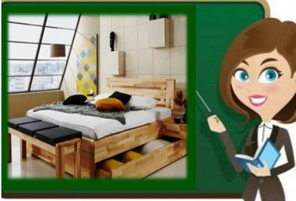
٩- أدرج أسفل السرير