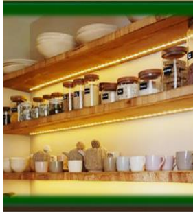
٤- إستخدام العلب بدلاً من الأكياس