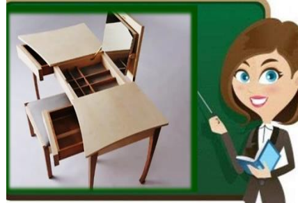
٨- أثاث الوظيفي أو متعدد الأغراض