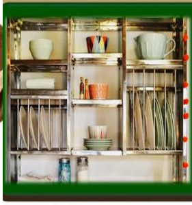
٢- إستخدام حامل معدني لتنظيم الأدوات في المطابخ الصغيرة