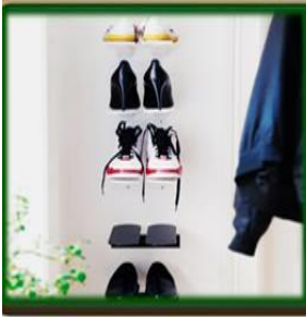
٧- أرفف صغيرة بجوار الباب لحفظ الأحذية