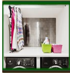
٦- تنظيم مكان الغسيل • إضافة لثامات للغسيل التنظيف • سلال بلاستيكية لحفظ سوائل التنظيف والماسحوق