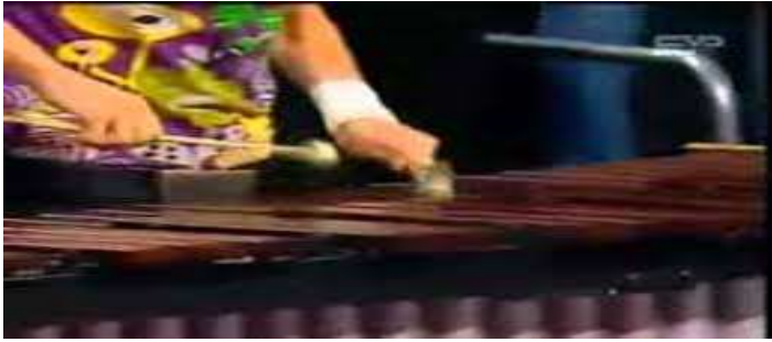
الشكل (٣) يوضح المسكة الصحيحة للمطرقة