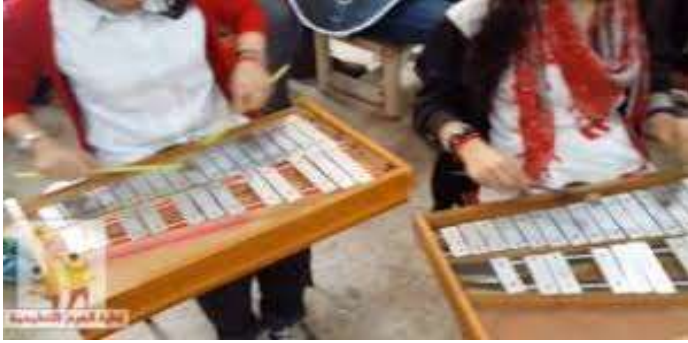
الشكل (٢) يوضح مكان الوقوف الصحيح أمام الآلة