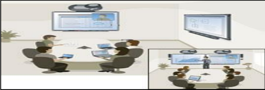
شكل ١: استخدام السبورة التفاعلية في التعليم

عن بعد عن طريق السبورة، وكذلك الرشاش منظم البقع الصعبة والبصمات وممحاة، وفأرة لاسلكية، وكابل توصيل، ووحدة للنظم اللاسلكية، والشريط المختصر (زاهر: ٢٠٠٩م).