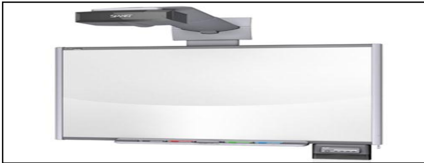
شكل ٢: سبورة تفاعلية مع سماعات وكاميرا

كما أن هناك بعض متطلبات التشغيل غير الأساسية ولكن وجودها يدعم وظائف السبورة الذكية مثل الكاميرا، والنظام الصوتي (سماعات ومضخم صوت) والطابعة.