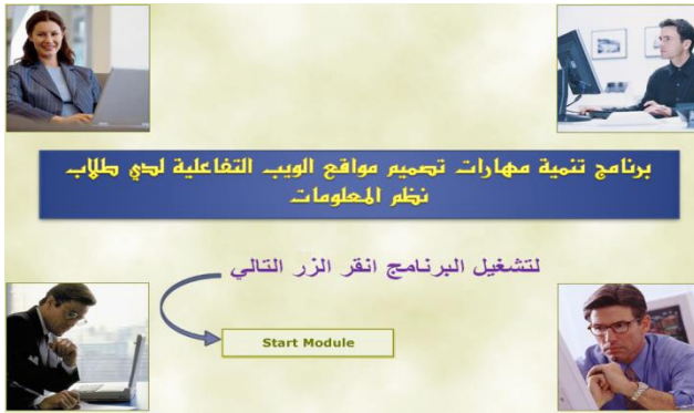
شكل (٣) أزرار الابحار في البرنامج

وقد راعى الباحثان فيها عنصر الجذب والتشويق لإثارة دافعية المتعلم من خلال الألوان الجذابة وبعض الصور.