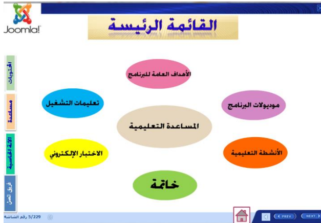
شكل (٦) قائمة الإبحار الرئيسية

تميز الروابط التي تنقل الطالب الى الإنترنت داخل البرنامج باللون الأزرق ويوجد خط أسفل الرابط.